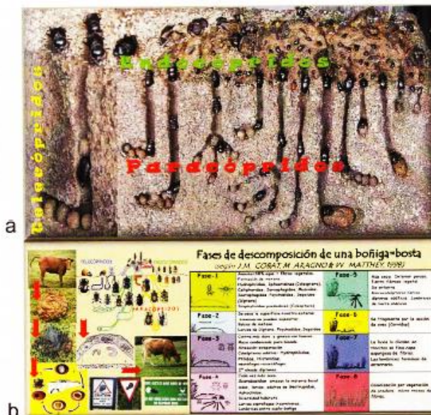
Fig. 2 Diorama de un ecosistema Coprófilo a) diversidad de insectos de una boñiga. b) Esquema de las etapas de su descomposición.

tiempo y en el espacio. La diversidad de comunidades no es sólo una cuestión de cuantos tipos diferentes de seres vivos los conforman, sino de qué tipos de procesos ecológicos funcionales se producen en ellos.