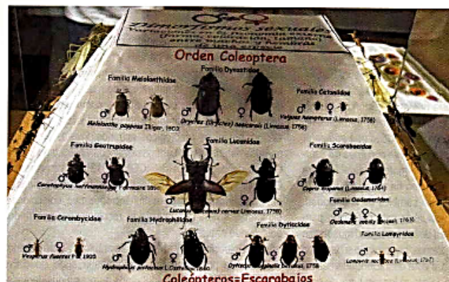
Fig.1 Diorama de Dimorfismos sexuales de Insectos.

La diversidad zoológica de comunidades hace referencia a las distintas formas de organización y relación de los conjuntos de especies de seres vivos que coexisten en el