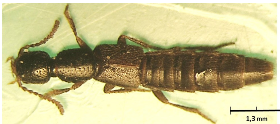
Fig.1. Habitus de Erichsonius (Sectophilonthus) algericus Coiffait, 1965, macho. Habitus of male Erichsonius (Sectophilonthus) algericus Coiffait, 1965.

Para diferenciar bien las especies entre sí, debido a los caracteres morfológicos externos muy poco diferenciables se tiene que observar con detalle diversos componentes de su edeago (Fig. 2), lóbulo medio, con su extremo agudo redondeado, con dos salientes laterales dorsales subapicales triangulares sin setas (Fig. 3). Parameros spatulados hacia el ápice, más largos que el lóbulo medio presentando cada uno 19 tubérculos sensoriales negros sobrepasando la mitad, desde el extremo libre (Fig. 2).