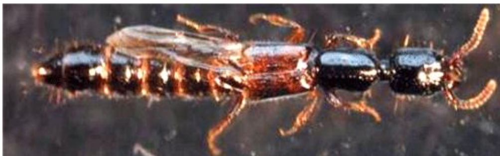
Fig. 3. - Ejemplar hembra de Nudobius lentus (Gravenhorst, 1806).

la mitad basal arqueada y la mitad distal recta y muy próximos entre sí. Lóbulo medio elipsoide y con válvula capsular circular (Fig. 4).