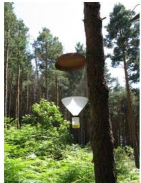
Fig.2.- Trampa ventana en un claro de un pinar de Montejo de la Sierra, Madrid.

Los ejemplares estudiados se encuentran depositados en la Colección Entomológica de la Facultad de Ciencias Biológicas de la Universidad Complutense de Madrid (UCME).