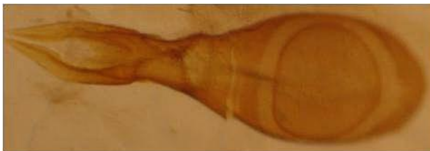
Fig. 4. - Edeago de Nudobius lentus (Gravenhorst, 1806).

Por estudios realizados en Francia, se ha comprobado su expansión por todas las regiones y hacia el sur (Coiffait, 1972; Soldati & Puissant, 2000). Lo mismo ocurre en Inglaterra (Alexander, 2002), donde se ha extendido mucho en los últimos años y ahora ocupa ya todo el sur de Inglaterra, donde Fowles et al. (1999) han establecido el índice SQI (Saproxyllic Quality Index) que establece una evaluación de la calidad de los hábitats boscosos para la conservación de la biodiversidad asociada a la madera muerta empleando como indicadores la presencia o ausencia de algunas especies de coleópteros, entre los que se encuentra Nudobius lentus . La causa de estas expansiones recientes se debe a la proliferación en épocas pasadas de repoblaciones con coníferas, que han dado lugar a la presencia en la actualidad de bosques afectados por plagas o incendios.